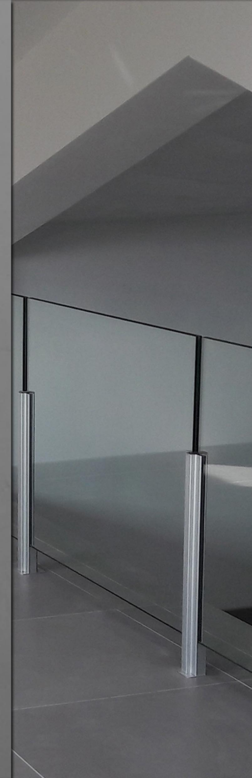
Avec main courant